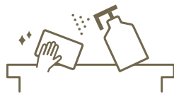
定期消毒の強化 Regular sanitisation

お客様が入替わる都度、テーブル/カウンターを消毒しております。 We sanitise tables/counters before and after customers use.