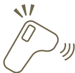
出勤時の体調、 健康管理

Physical condition is checked at time of the attendance.