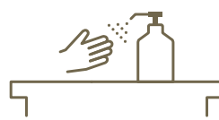
各テーブルに消毒液設置 Setting sanitisers

お客様が入替わる都度、テーブル/カウンターを消毒しております。 We sanitise tables/counters before and after customers use.