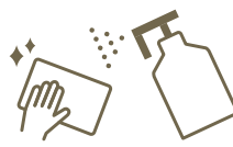
定期消毒の強化 Regular sanitisation

各フロアにおけるロビーや、レストラン、ショップ、化粧室に消毒液を設置しております。 We set sanitisers at lobby, restaurants, shops, and bathrooms at each floor.